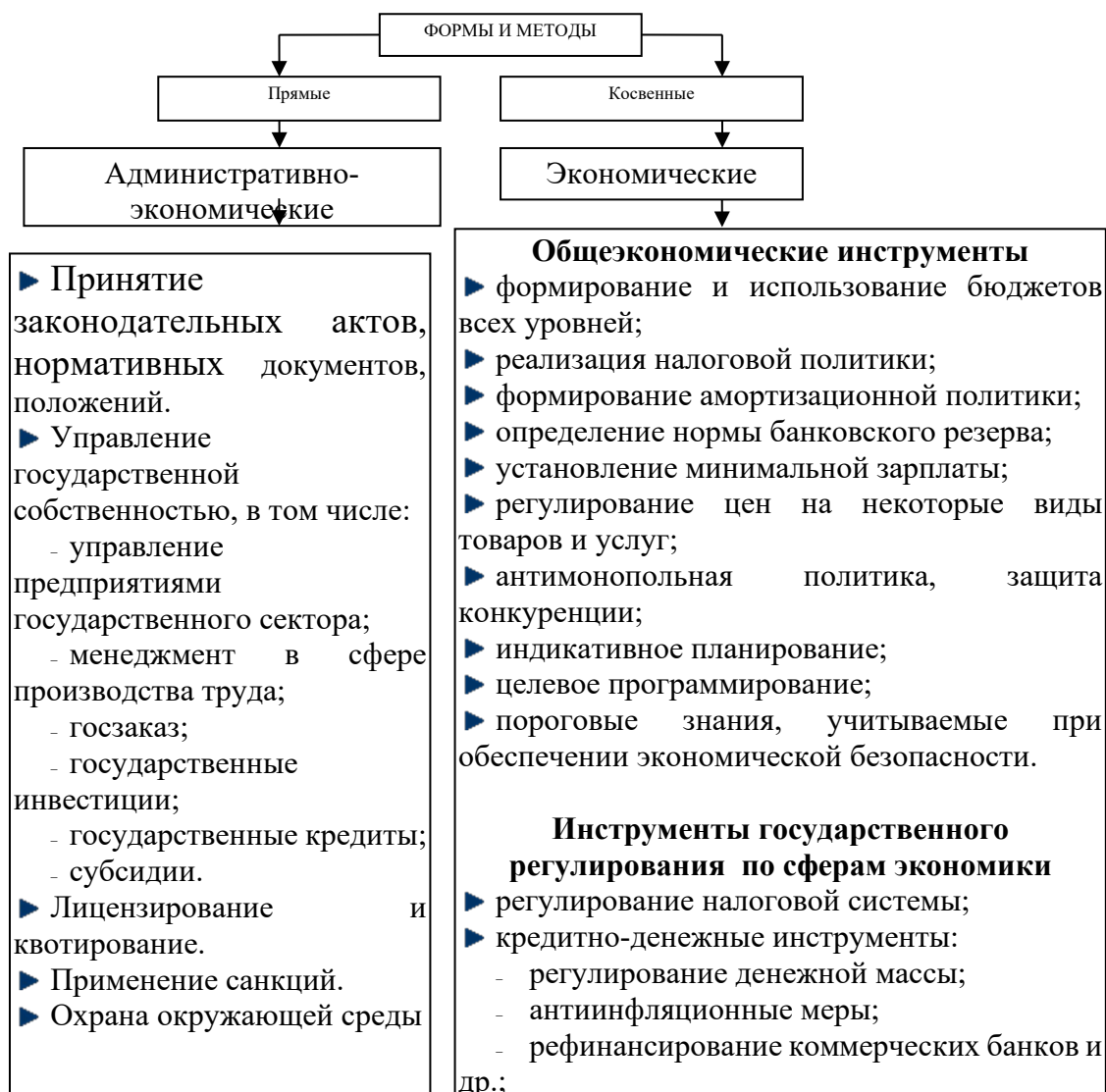
Рисунок – Инструментарий государственного регулирования экономики в условиях рынка

Основные инструменты госрегулирования экономики представлены на рисунке