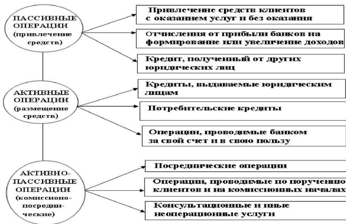
Рисунок 4 – Виды операций коммерческих банков

Разновидностью посреднических операций являются трастовые операции банков.