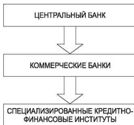
Рисунок 3 – Структура кредитно-банковской системы

Центральный банк страны является главным элементом кредитно-банковской системы любого государства. Исторически центральные банки возникли как коммерческие банки, наделенные правом эмиссии (выпуска) банкнот.