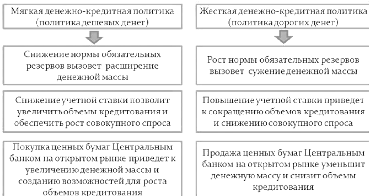
Рисунок 5 – Виды кредитно-денежной политики

Проблемы в реализации денежной политики создаются в основном циклической асимметрией. Ее эффективность может снижаться также в результате противонаправленного изменения скорости обращения денег.